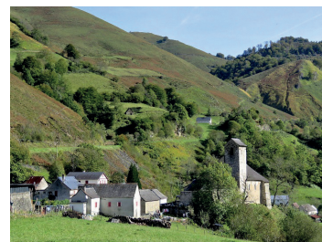
Eglise de Sainte Engrâce

L'étape ! Par les cols du Tour de France, splendide escapade à travers les hameaux fleuris de la province espagnole de Navarre (parcours plus facile également possible). En chemin : chapelle romane, pastoralisme, panoramas... ou, pour les moins aguerris, version courte (20 km) avec, en chemin, la visite des gorges de kakueta (à pied, 2 heures aller/retour). Dîner et nuit à l'hôtel** Etchemaïté, Logis de France 3 cheminées.