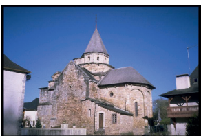
Eglise de l'Hôpital Saint Blaise