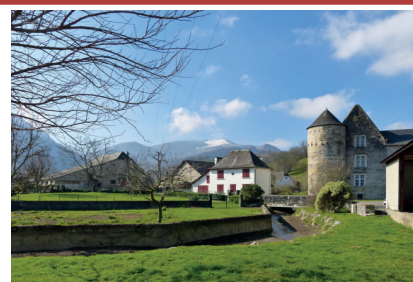
Le bucolique village d'Aussurucq

Dîner et nuit en chambre d'hôte, chez Eppherre, à Aussurucq.